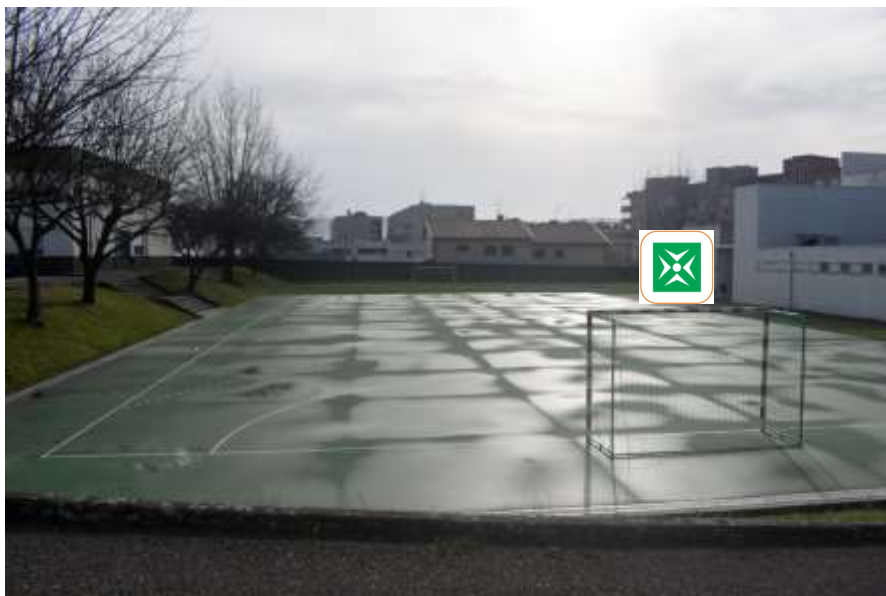
Fotografia do "Ponto de Encontro" LOCAL DE CONCENTRAÇÃO EXTERNA – “PONTO DE ENCONTRO”